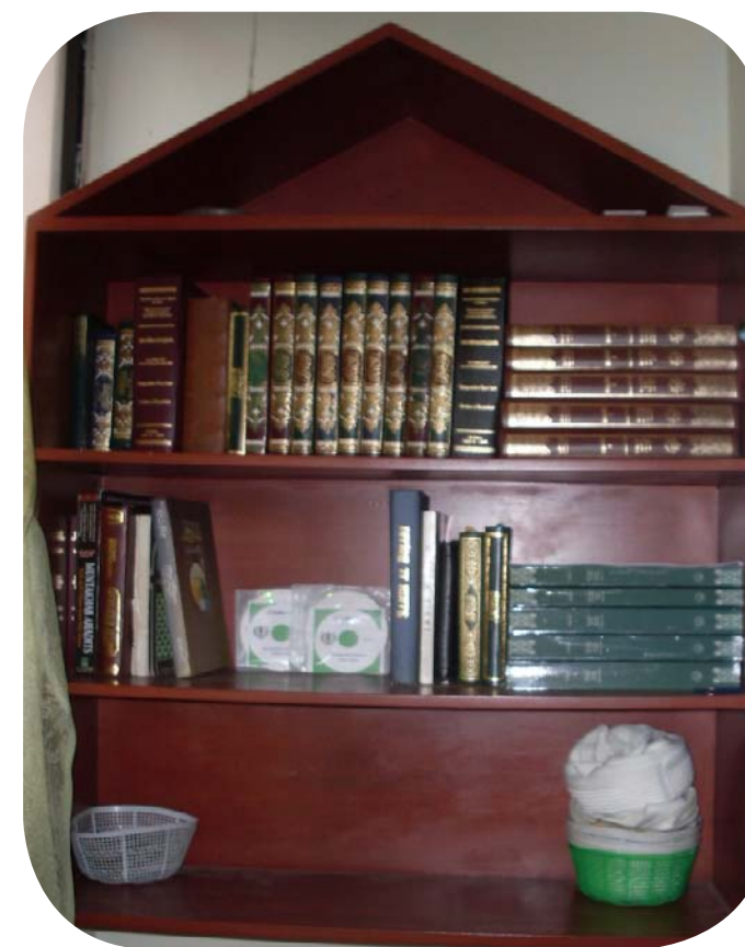
Estante con libros que contienen el Corán en árabe y su traducción al español y unos cds de recitaciones del Corán.