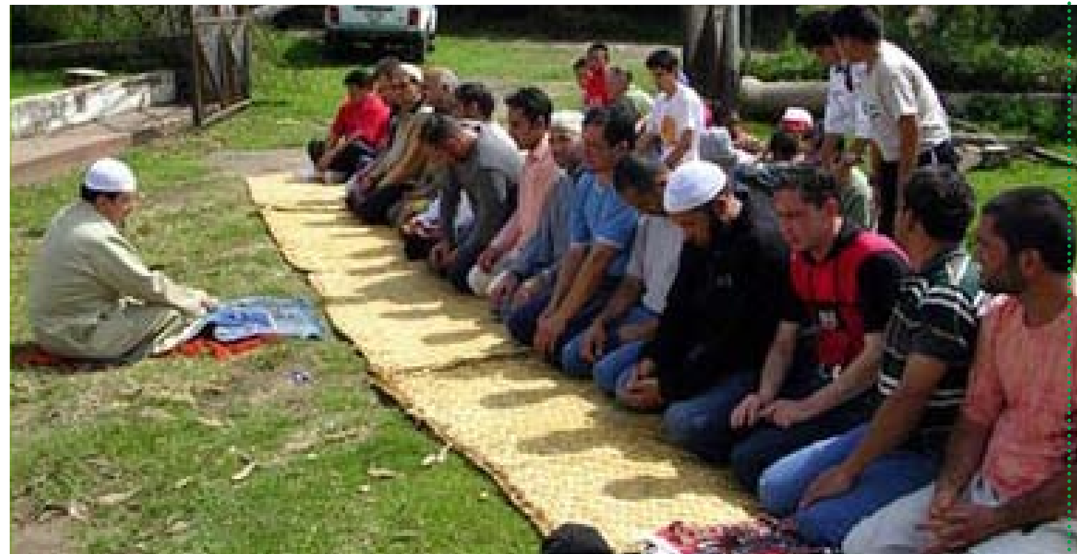
Oración colectiva en el Centro Islámico del Ecuador - Mezquita Assalam en Quito ubicada en: Calle 18 de septiembre E8-61 y General Leonidas Plaza.

Vi un vídeo que me hizo llorar, de una chica musulmana que contaba la historia de cómo empezó a usar su hiyab y otro donde una hermana decía que el hiyab simboliza esencia, pureza y respeto. Les escribí, luego me contactaron con mujeres musulmanas y Alhamdulillah después de casi 6 meses, aquí estoy feliz y orgullosa de ser musulmana.