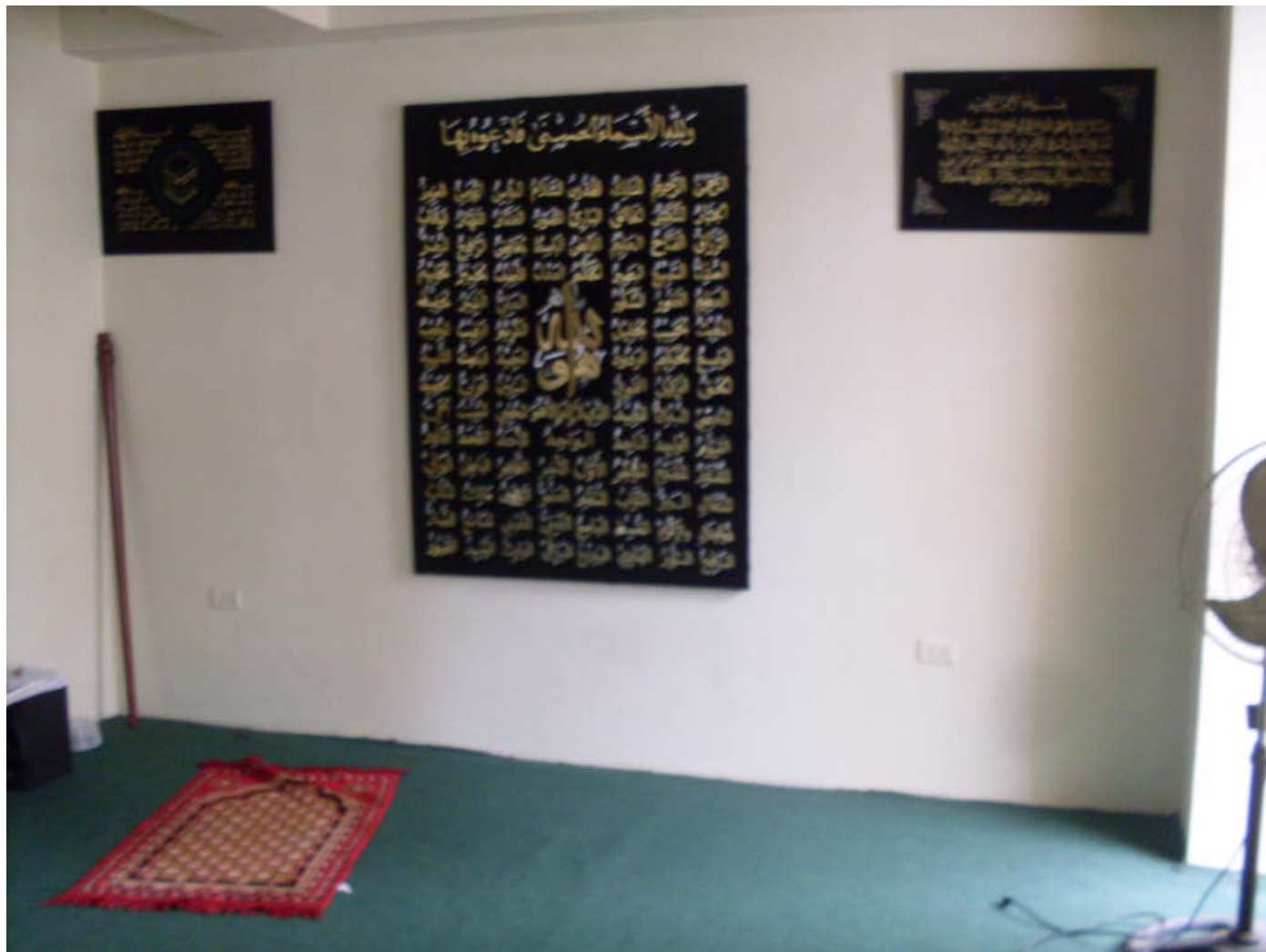
Centro Islámico Al Hijra de Guayaquil. Es un departamento acondicionado para el rezo congregacional, ubicado en el tercer piso del edificio número 720 ubicado en la calle P. Icaza, entre Boyacá y García Avilés.