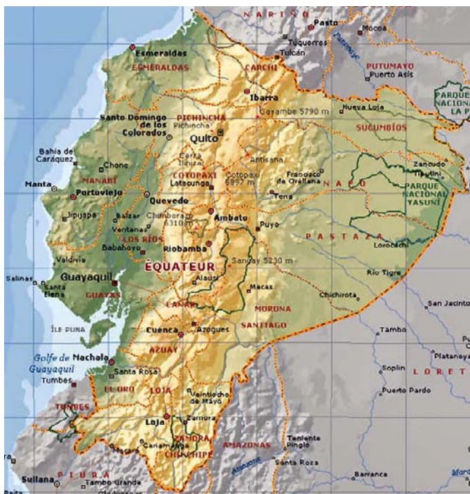
Mapa del Ecuador.