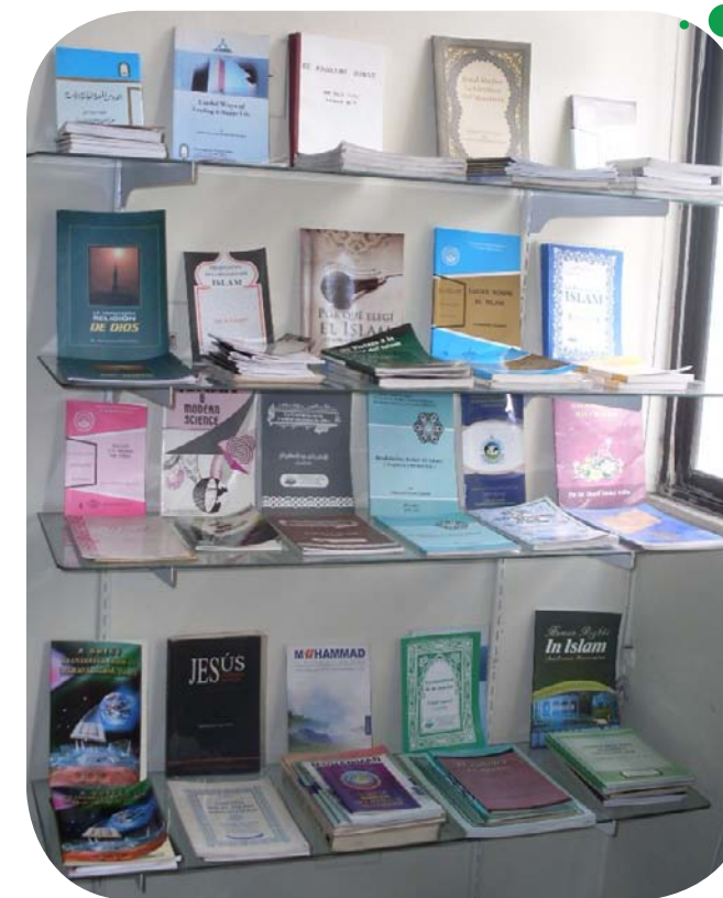
Libros sobre el Islam.

Sol qamar: En la ciudad la cual vivo ahora, cabe recalcar que uno de los motivos principales por los que me vine a vivir acá fue por mi Islam, quería enriquecer mis conocimientos, llevar una vida Islámica mejor; ya que donde vivía antes creo era la única musulmana y no