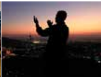
አላህን (እውነተኛውን አምላክ) የሚማፀን ሙስሊም