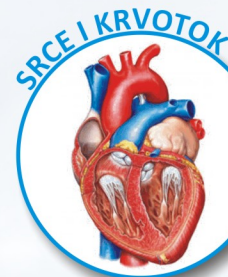
SRCE I KRVOTOK

treba da prekrije tu površinu je 60 – 140 ml. Da bi shvatili koliko je to tanak sloj tečnosti zamislite da se pola čaše vode razlije tako da prekrije prethodno spomenutu prostoriju 10x7 metara.